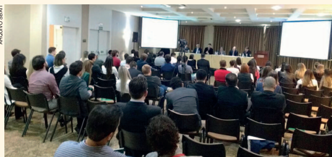
Congresso reuniu 200 participantes e membros da SBAIT de diversas regiões

A programação contou com ampla abordagem de temas rela-