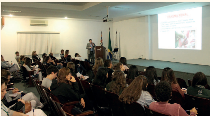
Jornada marcou os 20 anos de fundação da LCUT/FCMS

O evento reuniu, aproximadamente, 100 pessoas, entre alunos do curso de Medicina, residentes de cirurgia e médicos que, mesmo após a conclusão da residência, ainda possuem grande relação com a Liga.