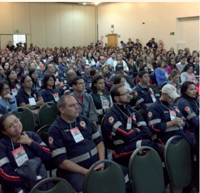
Evento recebeu muitos profissionais de Urgência e Emergência

O 1º Simpósio de APH (Atendimento Pré-Hospitalar), realizado em 16 de agosto, no Centro de Convenções Ribeirão Preto, em SP, marcou a comemoração dos 20